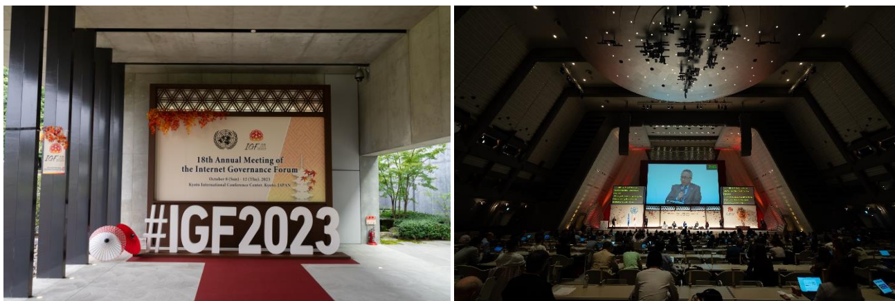
国立京都国際会館で行われた IGF 世界各国からの来訪者がセッション等に参加した

今回の会合では、全体テーマとして、“Internet We Want – Empowering All People –”（私たちの望むインターネット-あらゆる人を後押しするためのインターネット-）、サブテーマとして、①AI・先端技術、②インターネットの分断回避、③サイバーセキュリティ、サイバー犯罪、オンラインの安全性、④データガバナンス・トラスト、⑤デジタルデバイド・包摂性、⑥グローバルデジタルガバナンス・協力、⑦人権及び自由、⑧持続可能性・環境の8つが掲げられました。