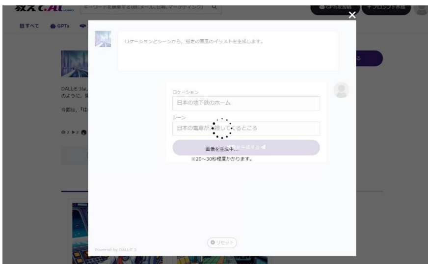
▲ 画像生成に必要な情報をテキストボックスなどに入力